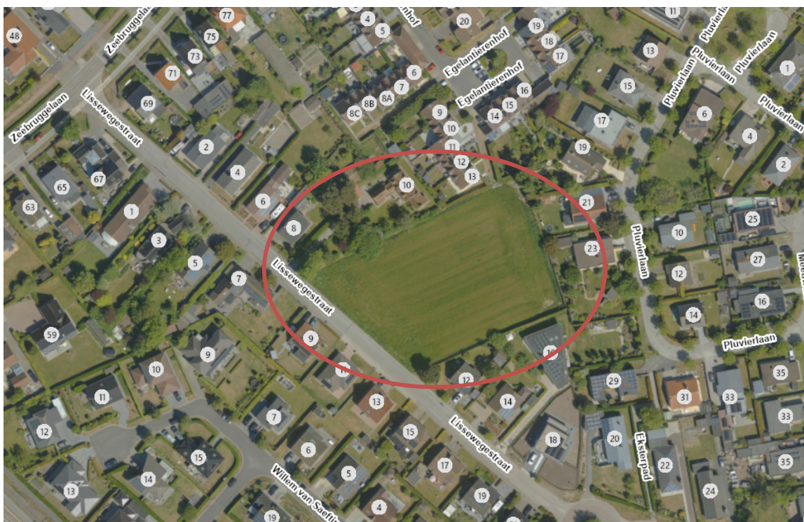
(luchtfoto met aanduiding plaats van de aanvraag)

Het ontwerp voorziet een verkaveling waarbij de grond verdeeld wordt in 6 loten: Loten 1-3 zijn gelegen langs de Lissewegestraat en zijn tussen de 495 m 2 en 652 m 2 groot. Tussen lot 1 & 2 wordt een lot 6 voorzien als wegeniszone voor de 2 achterliggende loten. Loten 4 & 5 (1278 m 2 en 1427m 2 ) zijn tevens voorzien voor de oprichting van een ééngezinswoning. Nevenbestemming zoals vrije beroepen, diensten en kantoren worden toegestaan voor maximaal 30% van de vloeroppervlakte.